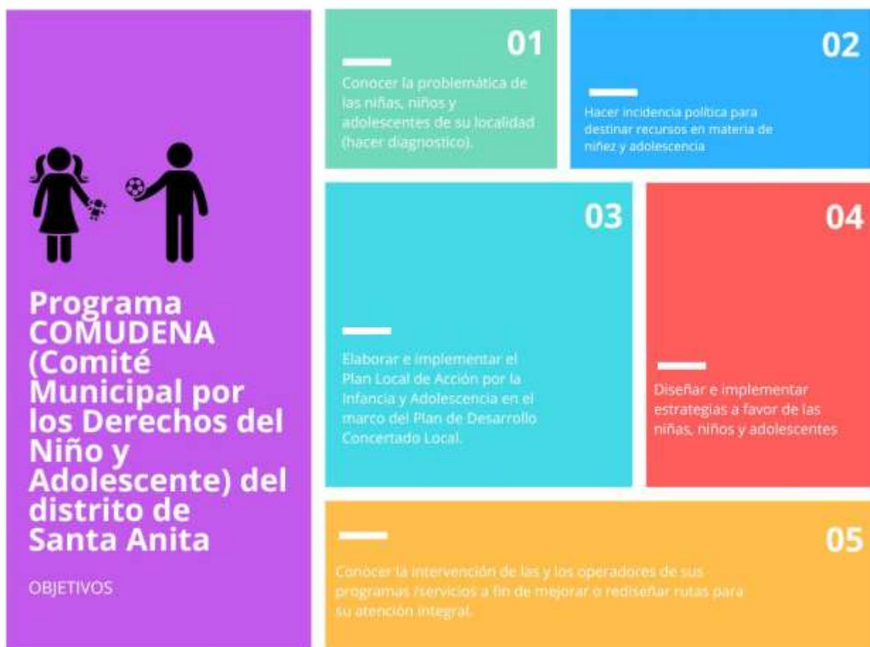
Ilustración 4 Objetivos del COMUDENA.

A continuación, se presentará el análisis de evaluación por cada objetivo del programa.