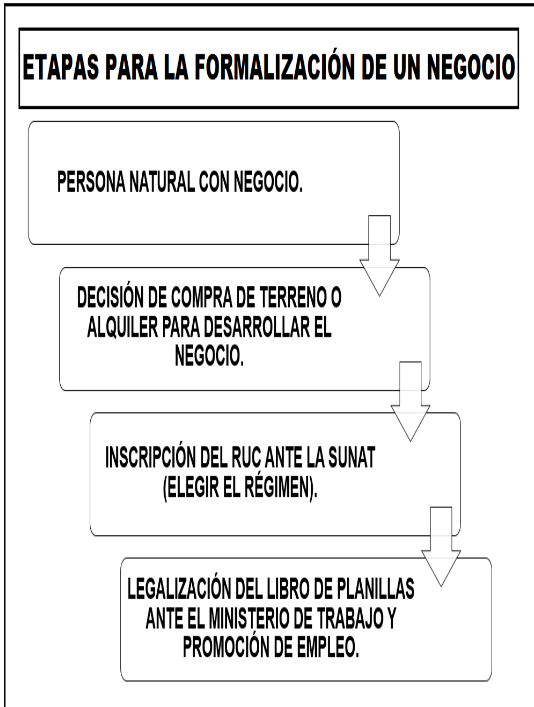
Cuadro Nro. 02