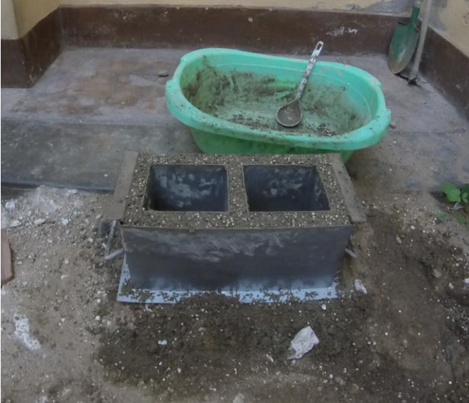
Foto N°4 Fraguado Se debe dejar el bloque de una día para otro en un lugar techado evitando su manipuleo.