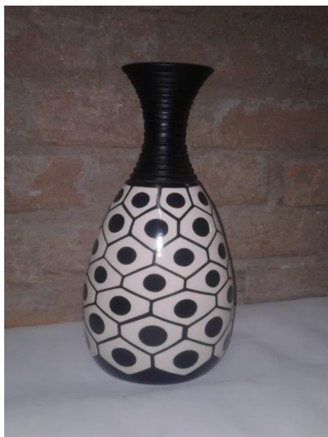
Vasija a dúo tono, donde predomina el color negro y formas geométricas, Autor Jesús Rivas López