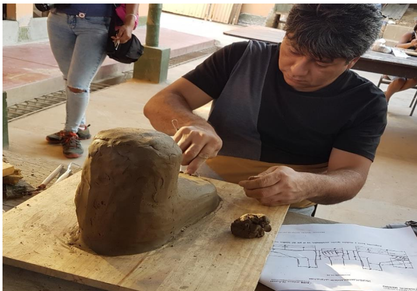
Realizando una pieza artística con arcilla, autor Jesús Rivas López.